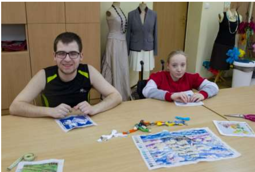
Uczniowie podczas wykonywania obrazka techniką haftu krzyżkowego

W trakcie wykonywanej pracy zwracam dużą uwagę na jakość i poprawność wykonywania haftu, a ta umiejętność wyrabia wrażliwość estetyczną u młodzieży, a także umożliwia zdobycie nowych umiejętności praktycznych.